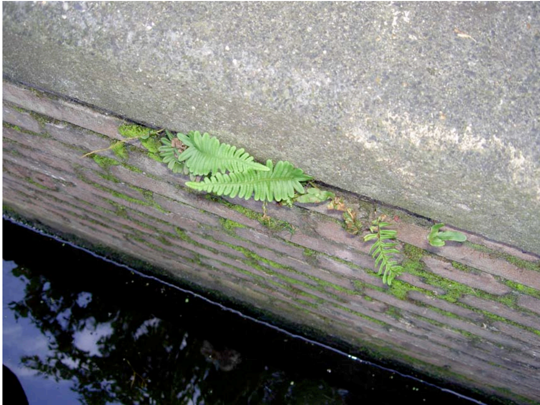
Gewone eikvaren op kademuur van de Emmakade