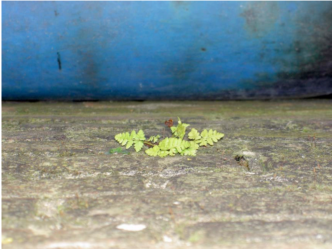
Waarschijnlijk Brede stekelvaren . Groeiplaats Emmakade. Nog niet gedetermineerd.