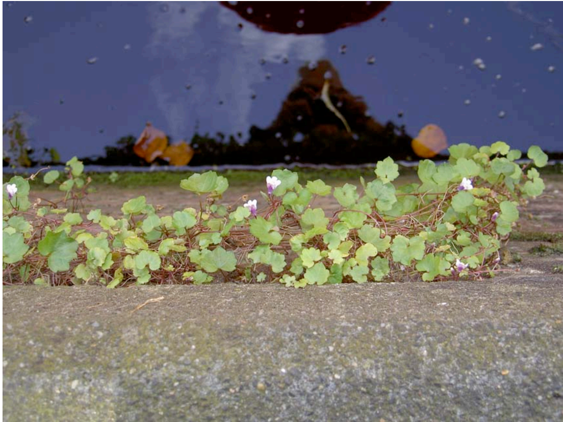
Muurleeuwenbek op kademuur Emmakade