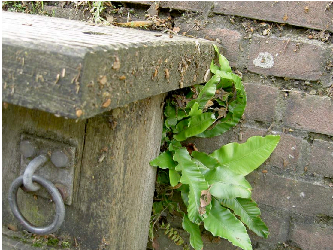
Tongvaren naast opstapje aan de Haven