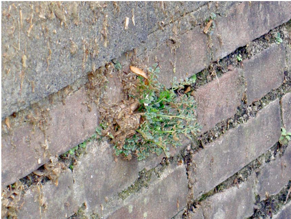
Muurvaren op "schoongespoten" kademuur aan de Haven

Leden van de KNNV hebben op dinsdag 13 september 2011 een inventarisatie uitgevoerd. Geïnterviewd werden de kademuren van Haven en Emmakade .