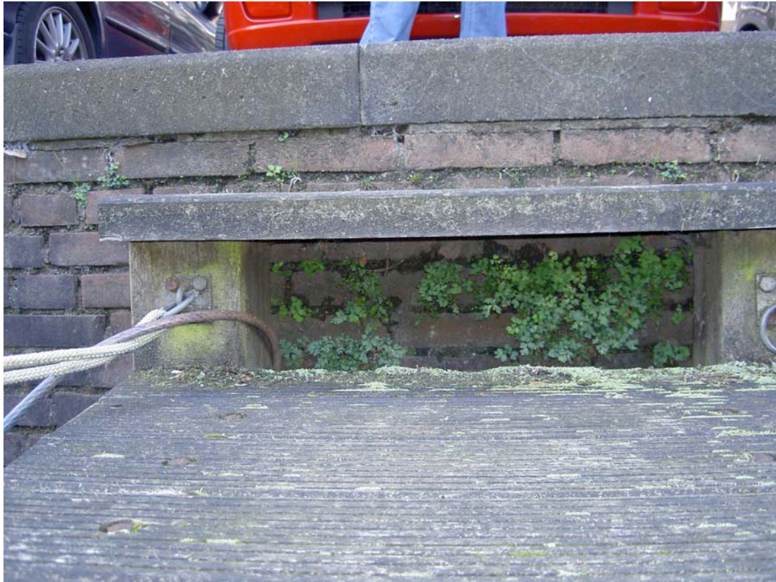
Muurvarentjes onder een steigeropstap langs de haven