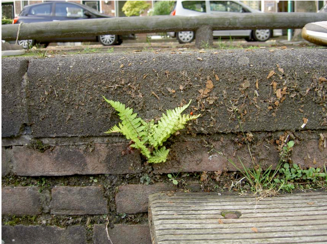
Mannetjesvaren boven opstapje aan de Haven