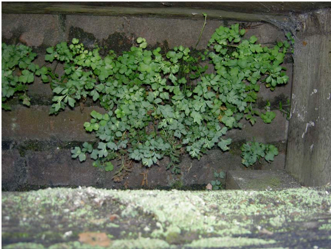
Muurvaren onder opstapje aan de Haven

De volgende soorten specifieke muurplanten werden aangetroffen: