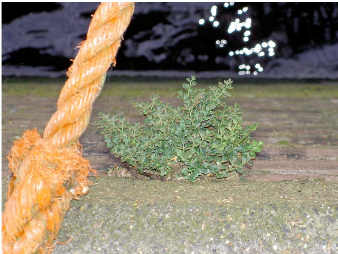
Een van de grotere Muurvarenplantjes, hier beschermd tegen de 'grote schoonmaak' door de groeiplaats onder een tros van een van de schepen in de haven.